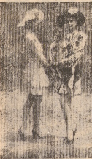
Манекенщицы Киевского дома моделей демонстрируют новые образцы одежды из грузинского шелка.