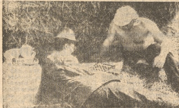
Загружена очередная тележка. Можно немного отдохнуть.