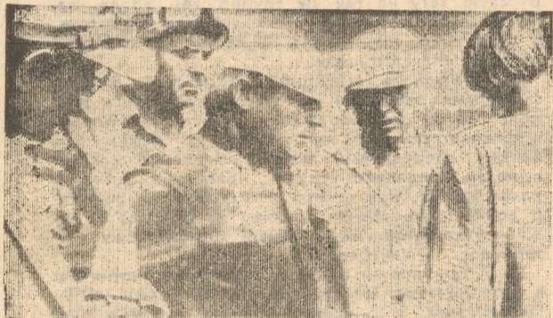
Почти месяц бригада из цеха № 17 работает на заготовке сена.