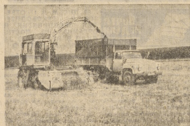
кормит рабочих прямо в Васильевича Бессонова.