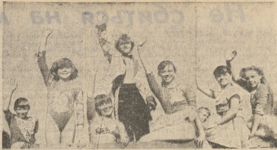
Приехал цирк! Юные артисты народного цирка Дворца культуры и техники Новотрубного завода часто выезжают с концертами на село.