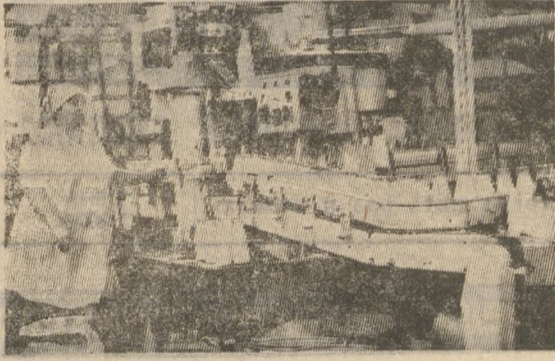
На снимке: линия розлива диетпродуктов на гормолзаводе.