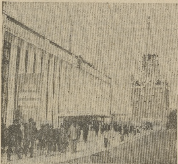
На снимках: депутаты направляются на заседание Съезда народных депутатов. Во время заседания Съезда народных депутатов.