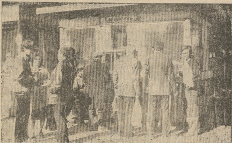
Каждый из нас имеет сегодня возможность благодаря телевидению и радио почувствовать себя участником Съезда народных депутатов СССР, сделать из увиденного и услышанного свои собственные выводы.

В целом же Съезд не оставляет никого равнодушным, люди жадно впитывают все, что происходит на нем, и в этом его огромное значение.