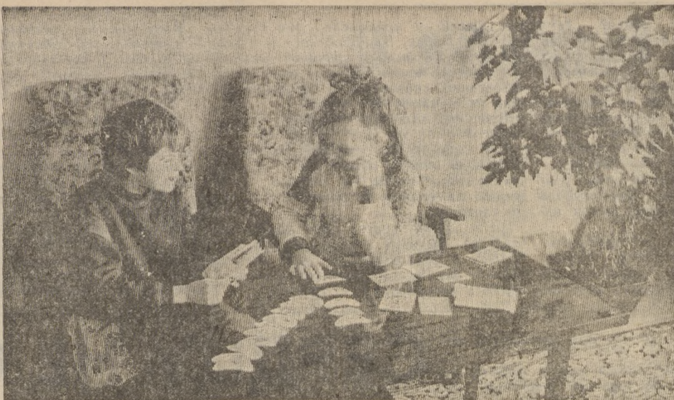
Дворец водных видов спорта. Перед тренировкой.