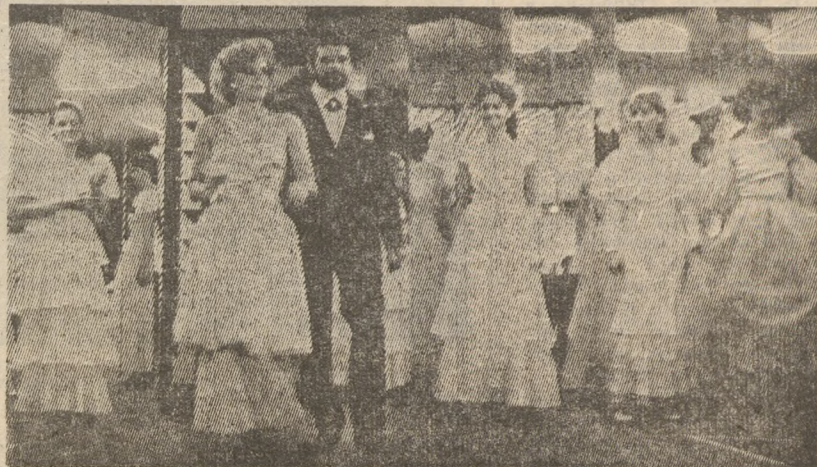
■ НЕОЖИДАННЫЙ РАКУРС