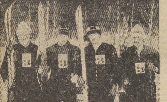
Успешно закончили зимний спортивный сезон лыжники третьего цеха Новотрубного завода. На заключительных соревнованиях по лыжному многоборью команда заняла второе место в общекомандном зачете, а по результатам трех эстафет лыжники заняли первое место.