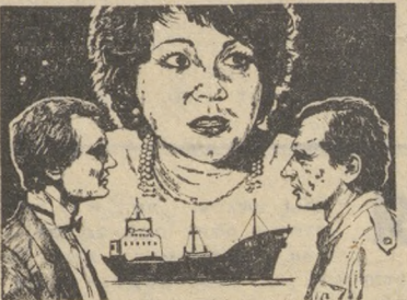
БАРМЕН ИЗ ЗОЛОТОГО ЯКОРЯ.

Кинотеатр «Восход». 24, 25 марта «НЕУКРОТИМАЯ МАРКИЗА» (2 серии). Сеансы: 9, 12, 15, 18, 21 час. Кинотеатр «Космос». 24, 25 марта «ТАИНА ЖИТЕЛЕЙ ЛУНЫ». Сеансы: 9, 11, 13, 15 час. Клуб филиала Новотрубного завода. «ВАЛЕНТИН И ВАЛЕНТИНА». Сеансы: 18, 20 час. Клуб имени В. И. Ленина. «КАК СТАТЬ СЧАСТЛИВЫМ». Сеансы: 18, 20 час. Дом культуры горняков. «ДОСЬЕ ЧЕЛОВЕКА В «МЕРСЕДЕСЕ». Сеансы: 17-30, 20 час.