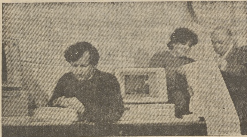
Завтра — День советской науки