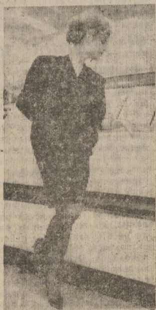
Н. М. КАЗАРИН

На снимке: эта модель одежды выполнена из ткани, выпускаемой в цехах Могилевского объединения. Фото В. ВИТЧЕНКО. С ЖЕЛТОВИЧА (фотохроника ТАСС).