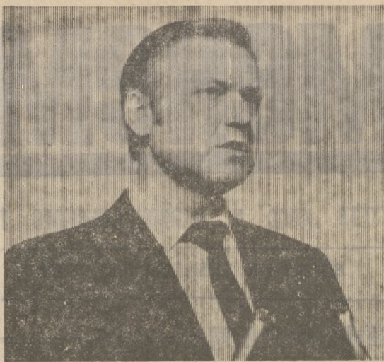
* Портрет современника: «КАКИЕ МЫ ЕСТЬ?»

А чем, скажем, рождена предстоящая повестка дня? Казалось бы, нет оснований для тревоги. Ведь на предприятии сложилась школа передового опыта по внедрению хозрасчета и его элементов, в то время как отдельные экономические