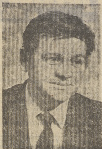
ЗА «КРУГЛЫМ СТОЛОМ» РЕДАКЦИИ

Активно ищут пути формирования трудящихся на динасовом заводе, где сейчас пересматривается время выхода радиопередач, где выпускается ежедневная стенная газета. В