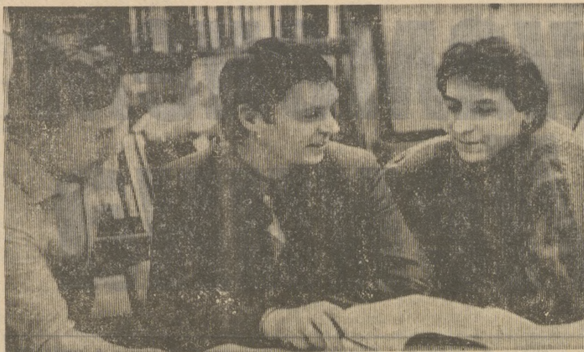
В лаборатории автоматизации трубопроводных и вспомогательных цехов ЦЛАМ Новотрубного завода постоянно ведется поиск новых технологий отделки труб, а также разработка систем автоматизированного управления технологическими процессами.

В нынешнем году внедрена первая система управления с использованием программируемого микропроцессорного контроллера на линии отделки цеха № 9.