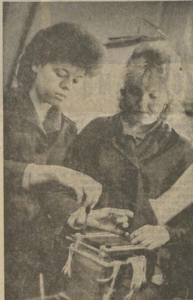
■ ВПЕРВЫЕ НА ЗАВОДЕ