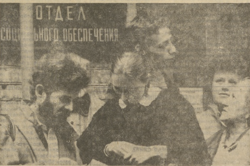
■ ИЗ ПОЧТЫ РЕДАКЦИИ