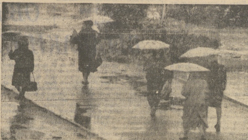
Дождя ждали целое лето...