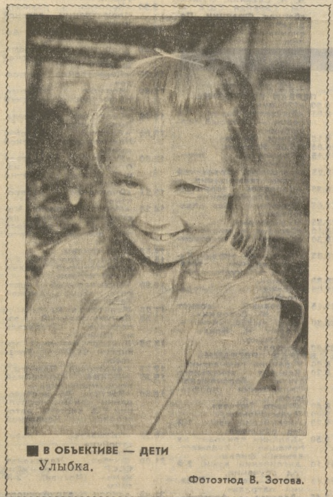
■ В ОБЪЕКТИВЕ — ДЕТИ Улыбка.