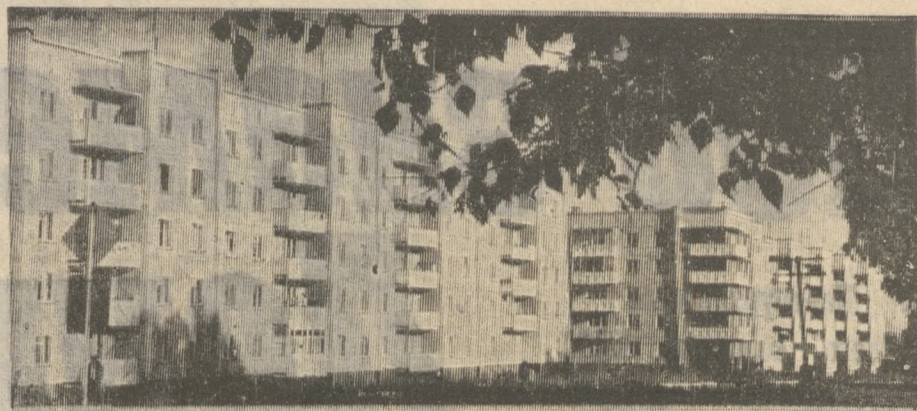
■ С ФОТОАППАРАТОМ ПО ГОРОДУ