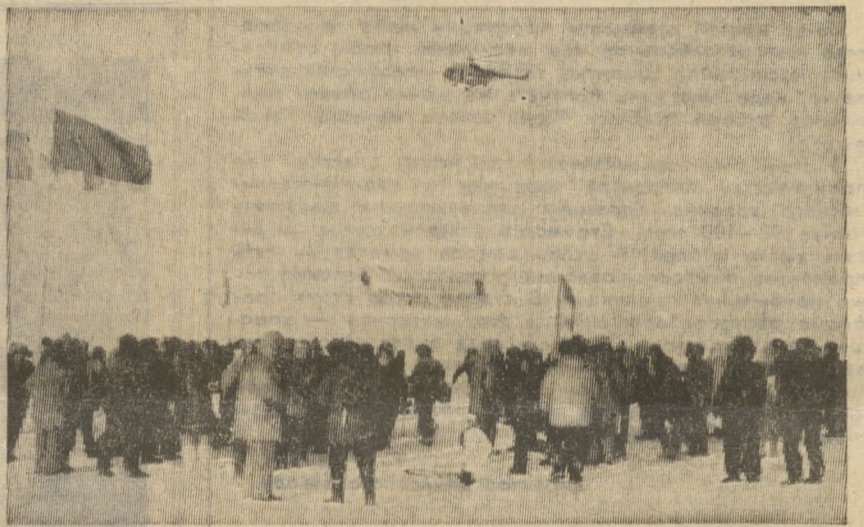
НАШ ЗЕМЛЯК ОБЕСПЕЧИВАЛ СВЯЗЬ СОВЕТСКО-КАНАДСКУЮ ТРАНСАРКТИЧЕСКУЮ ЭКСПЕДИЦИЮ