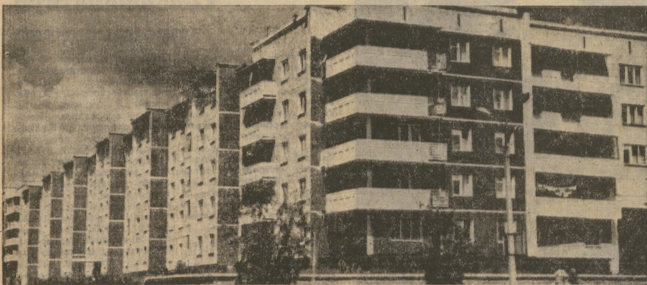
Новые дома на улице Трубников.