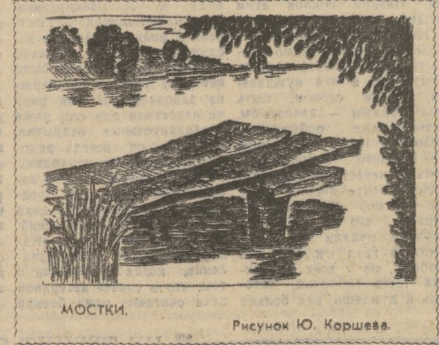
МОСТКИ. Рисунок Ю. Коршева.