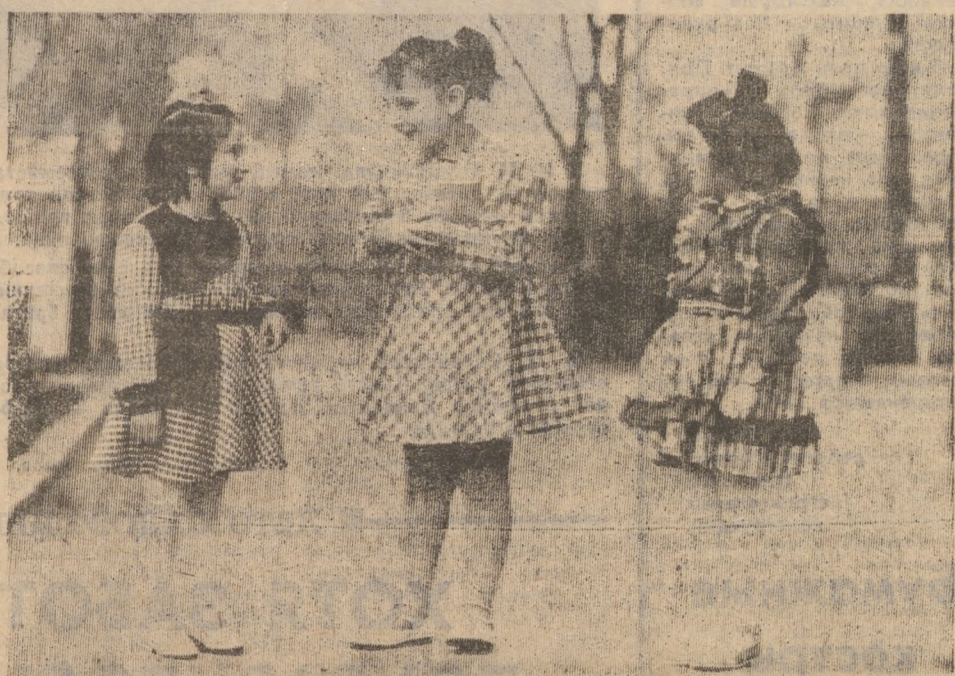
Когда на всех обновы.