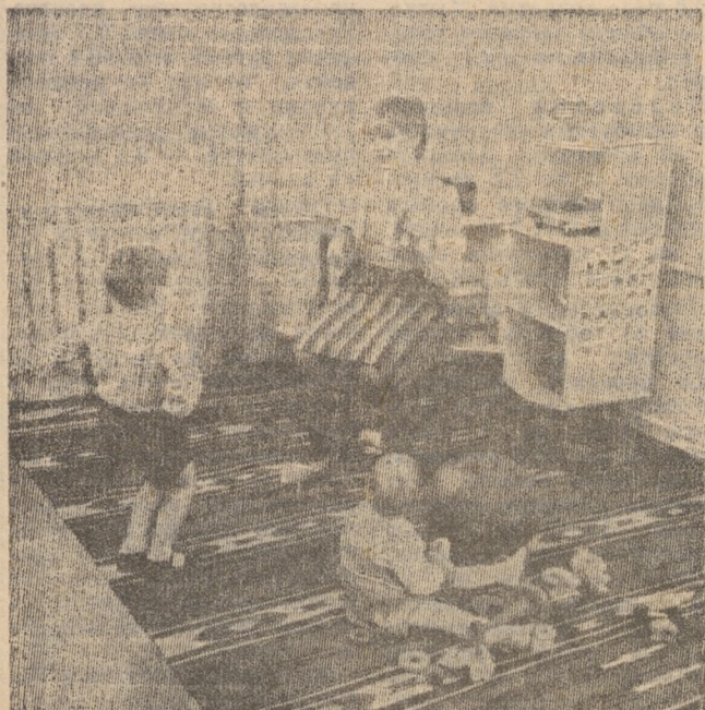
ВЕСТИ ИЗ ШКОЛ