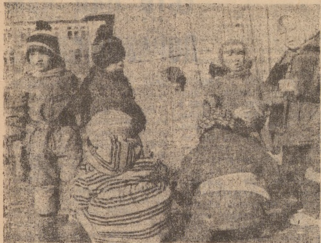
Детский сад № 10 Новотрубного завода. На прогулке.