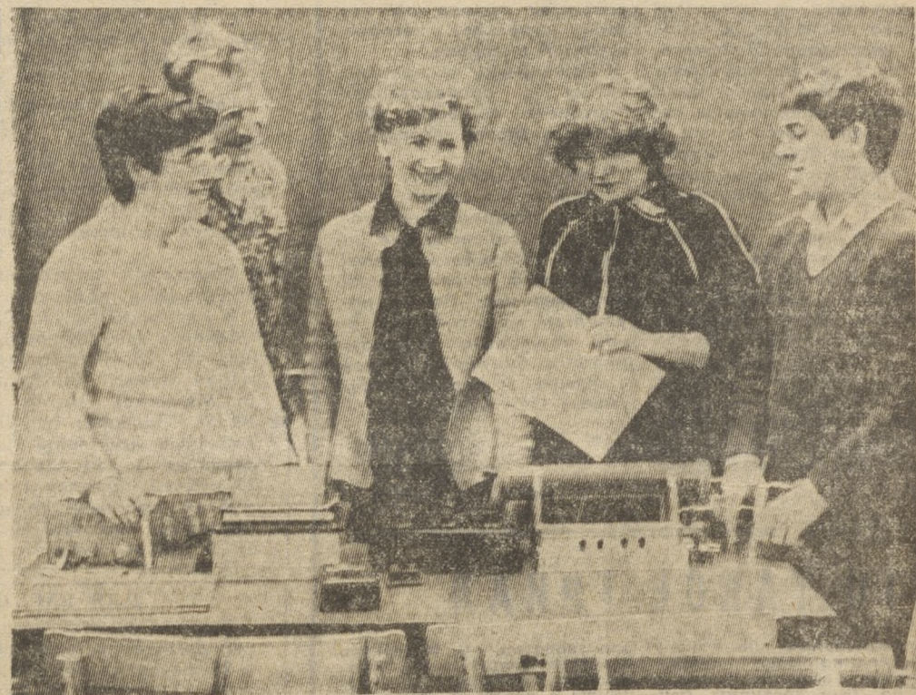
Студенты общетехнического факультета УПИ имени С. М. Кирова после зимней экзаменационной сессии и каникул вновь приступили к занятиям.