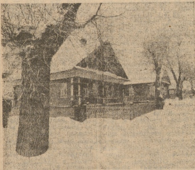
После мартовского снегопада.