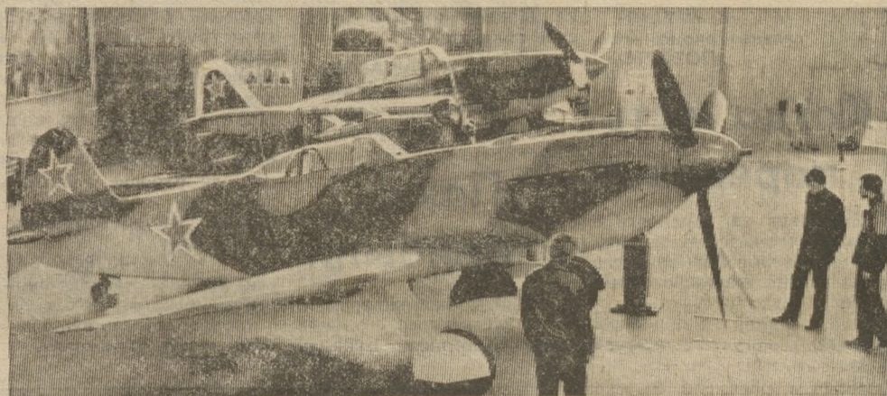
От копии первого в мире четырехмоторного самолета «Илья Муромец», совершившего свой полет в конце 1913 года, до авиационной техники наших дней можно увидеть в экспозиции музея Военно-Воздушных Сил в подмосковном городе Монино.

На снимке: самый массовый фронтовой истребитель Великой Отечественной войны самолет Як-9, созданный коллективом, которым руководил генеральный конструктор дважды Герой Социалистического Труда А. С. Яковлев.