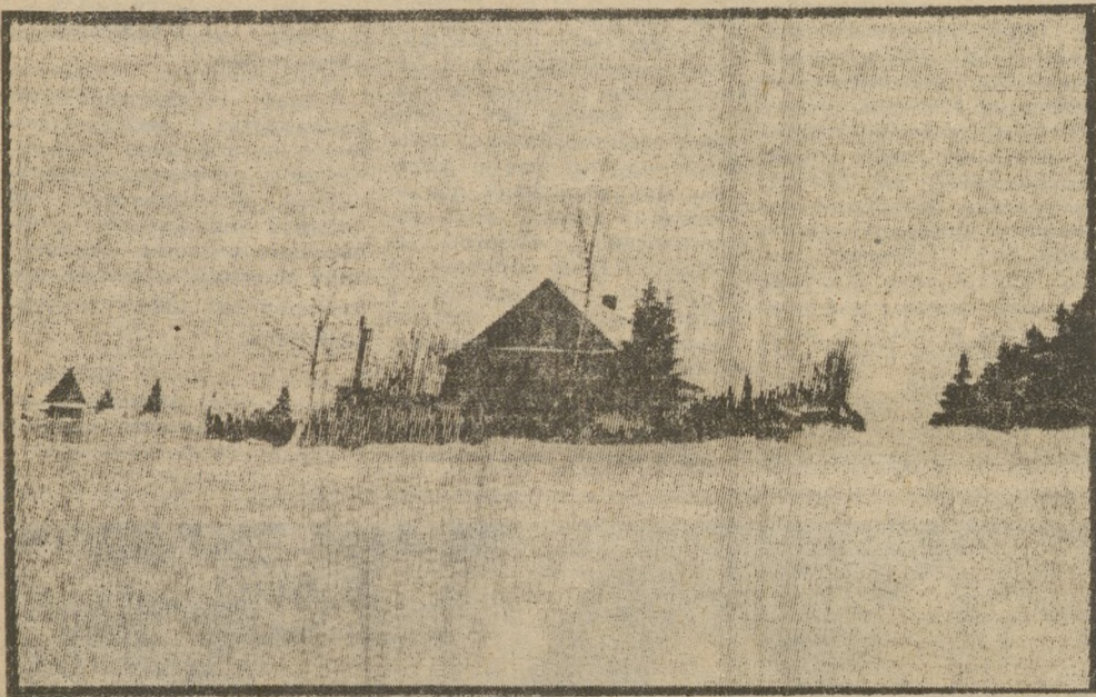
ДОМИК НА ОКРАИНЕ.