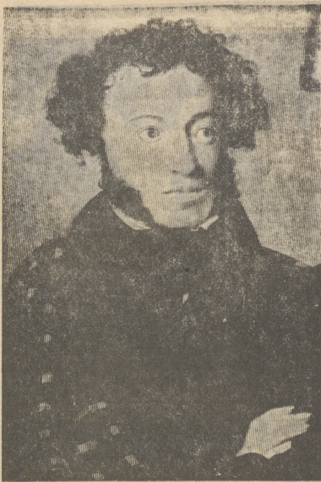
На снимках: одно из лучших произведений О. Кипренского — портрет А. С. Пушкина, в котором отражено настроение поэта после декабристской поры, вре-