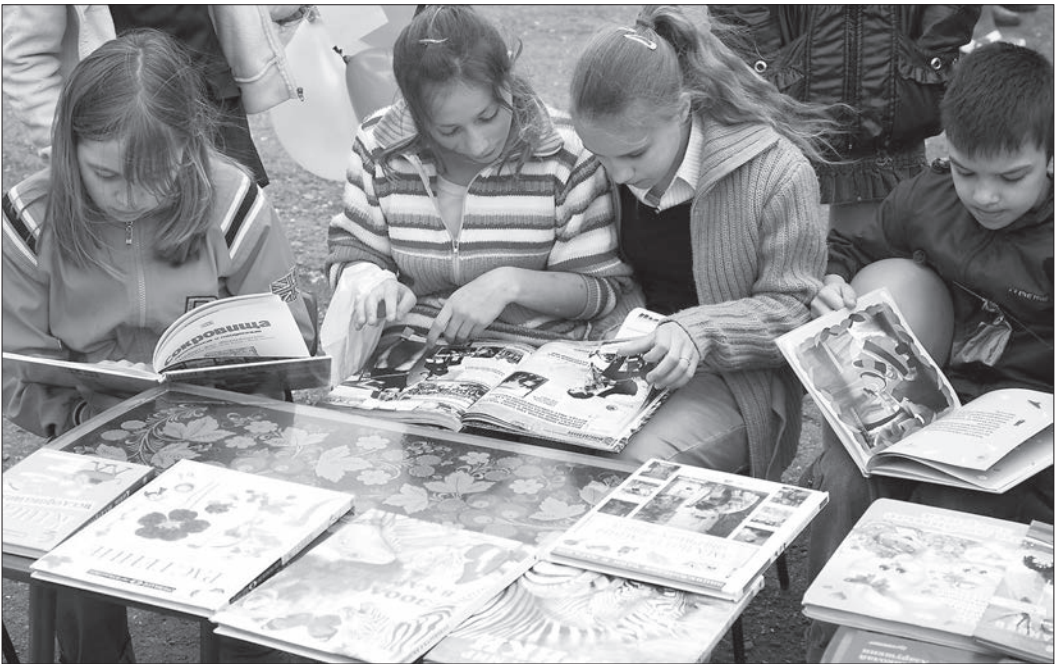
* Читальный зал под открытым небом.

Несмотря на муроме небо, настроение у ребят было радостное и они с удовольствием приняли участие в литературных викторинах и веселых стартах, организованных сотрудниками цен-