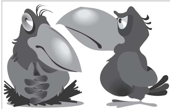
Иллюстрация Ларры Угрюмова

Сотрудники мэрии Южно-Сахалинска обратились в местное отделение управления по делам ГО и ЧС с просьбой выселить с территории городской администрации семейство агрессивных ворон, сообщает «Интерфакс».