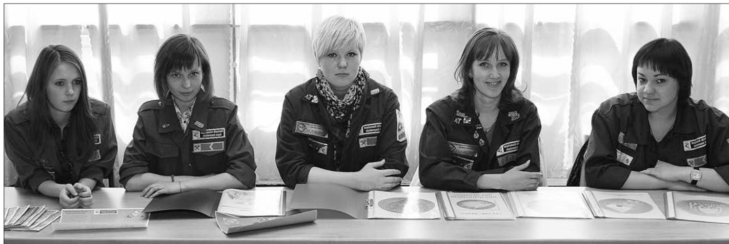
* Участники ярмарки-презентации - представители студенческих отрядов.

низации музея лица №51. В этом году образовательному учреждению исполнится 20 лет, подарком станет современный выставочный комплекс на базе двух суще-