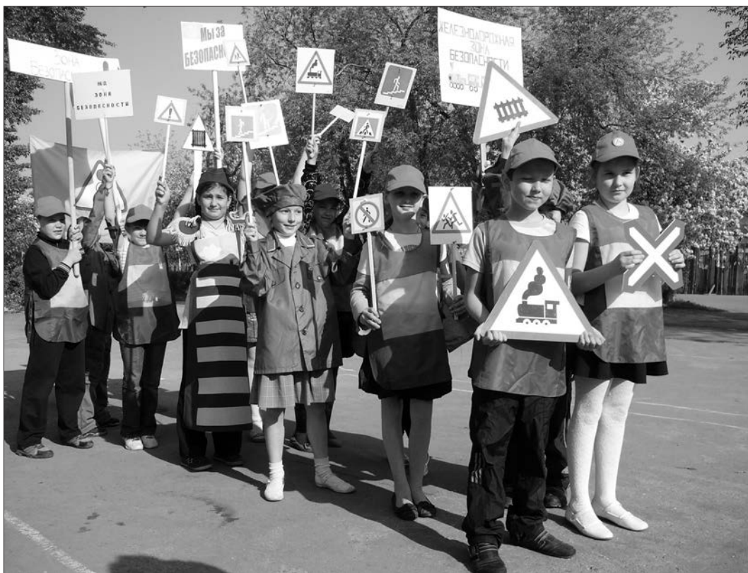
Воспитанники отряда «Юный пешеход» вышли на улицы города с плакатами и дорожными знаками.

Под таким названием завершился месячник дорожной безопасности, проходивший в детском центре «Мир».