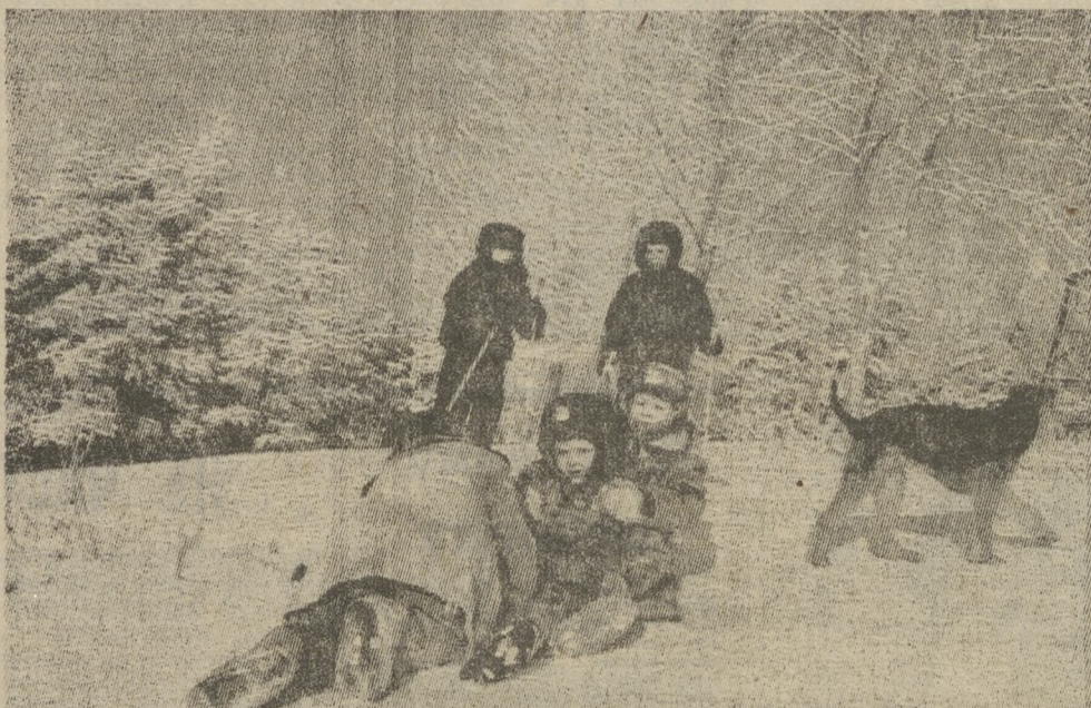
Мальчишки — радостный народ.