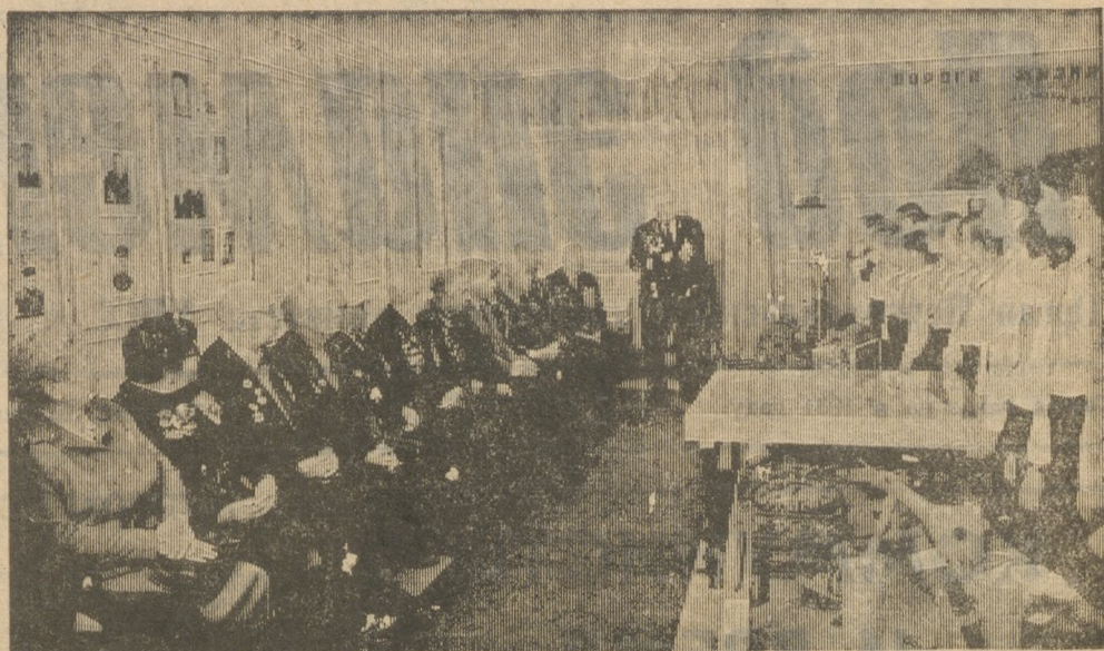
■ 18 ЯНВАРЯ — 45 ЛЕТ СО ДНЯ ПРОРЫВА (1943 г.) СОВЕТСКИМИ ВОЙСКАМИ БЛОКАДЫ ЛЕНИНГРАДА

Вроде бы дела идут на фабрике неплохо, однако партбюро предстоит еще немало поработать. Смотр боевистости, отчеты коммунистов показали: нам надо принципиальнее, настойчивее добиваться, чтобы решения доводились до конца, а секретарю строже спрашивать с коммунистов за выполнение поручений. Особое внимание уделим усилению воспитательной роли партийцев в бригадах, сменах. Будем работать над расширением гласности. Наглядную агитацию, стенную газету ориентируем на актуальные задачи дня.