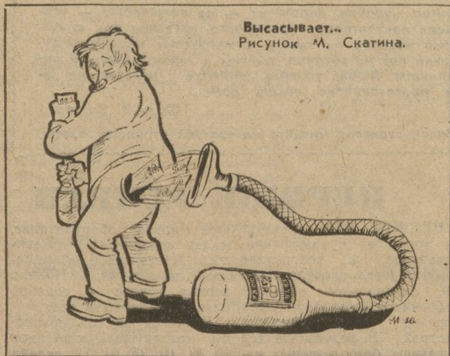
Высасывает...