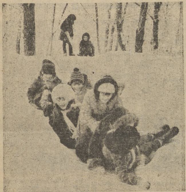
На снежной горке.

приглашает первоуральцев в субботу и воскресенье. Для них работают прокат лыж, санок, лотков, санный поезд.