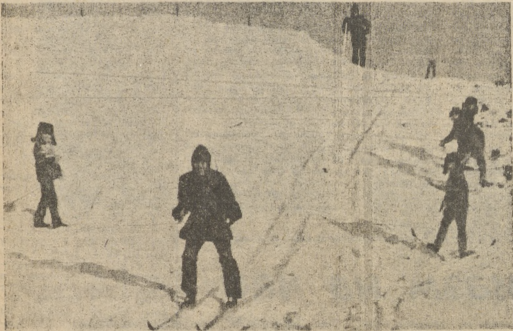
В солнечный полдень.

пом. директора завода комплектных металлоконструкций по быту.