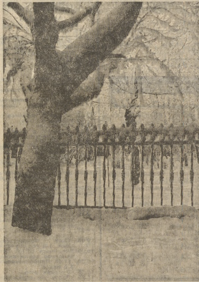
Узор снежных волшебство.