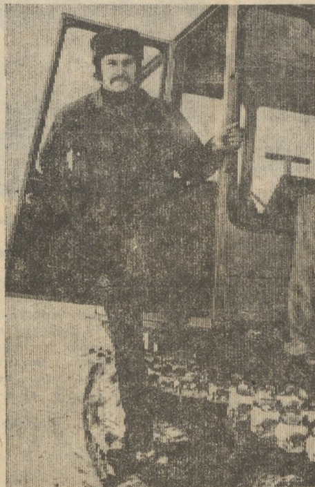
«Коллективы совхозов «Первоуральский», «Битимский» досрочно, к 7 ноября, выполнили план двух лет пятилетки по продаже государству всех видов сельскохозяйственной продукции. (Из сообщения городской плановой комиссии)