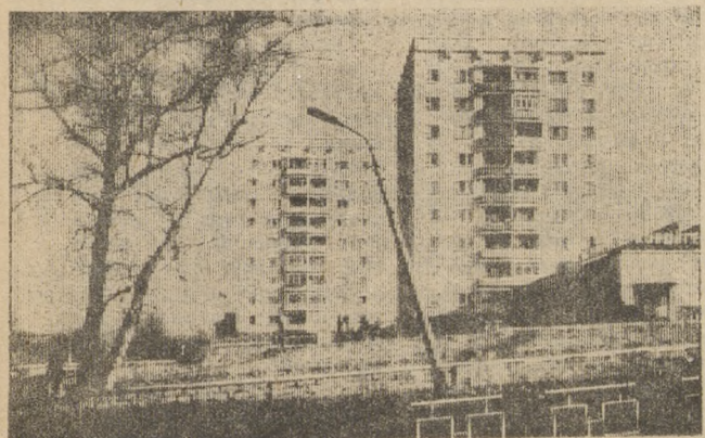
С ФОТОАППАРАТОМ ПО ГОРОДУ На улице Ленина.

Л. ЧЕРНЫШОВА, заведующая читальным залом.