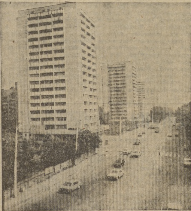
РОСТОВ-НА-ДОНУ. Один из красивейших проспектов города — Ворошиловский.