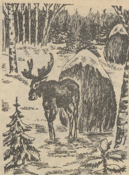
В зимнем лесу.