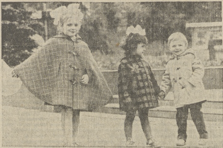
БЕЛОРУССКАЯ ССР. Коллектив Оршанской опытно-экспериментальной фабрики по изготовлению верхней детской одежды первым в республике перешел на стопроцентное обновление ассортимента, налажив тесный контакт с торговыми организациями, постоянно изучает спрос на свои изделия. В цехах и на участках внедрена коллективная ответственность за результаты труда. Организовано социалистическое соревнование за звание «Поток отличного качества». Усилия коллектива приносят ощутимые результаты.

На снимке: изделия фабрики демонстрируют воспитанники детского сада № 39.