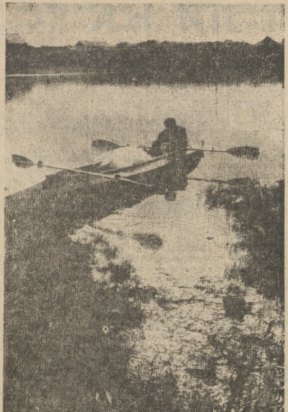
Солнце клонится на запад. Причал. Причал. А утром в путь опять.