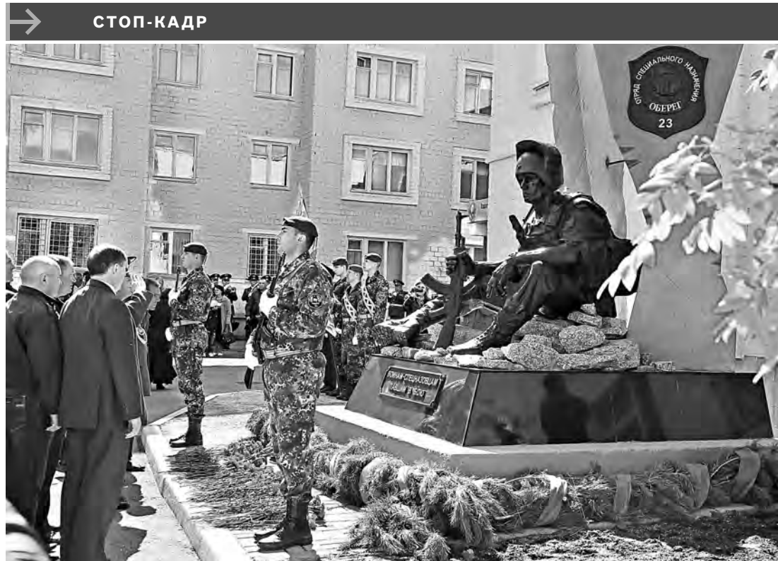
В Челябинске открыли памятник российским военнослужащим, погибшим на Северном Кавказе. Скульптурная композиция установлена на территории расположения отряда специального назначения «Оберег», который в эти дни семь лет назад в столкновении с бандформированиями понес большие потери: четверо бойцов погибли, еще несколько были ранены. Всего с 2003-го по 2012 год в служебных командировках на Северном Кавказе, выполняя воинский долг, погибли 12 военнослужащих отряда.