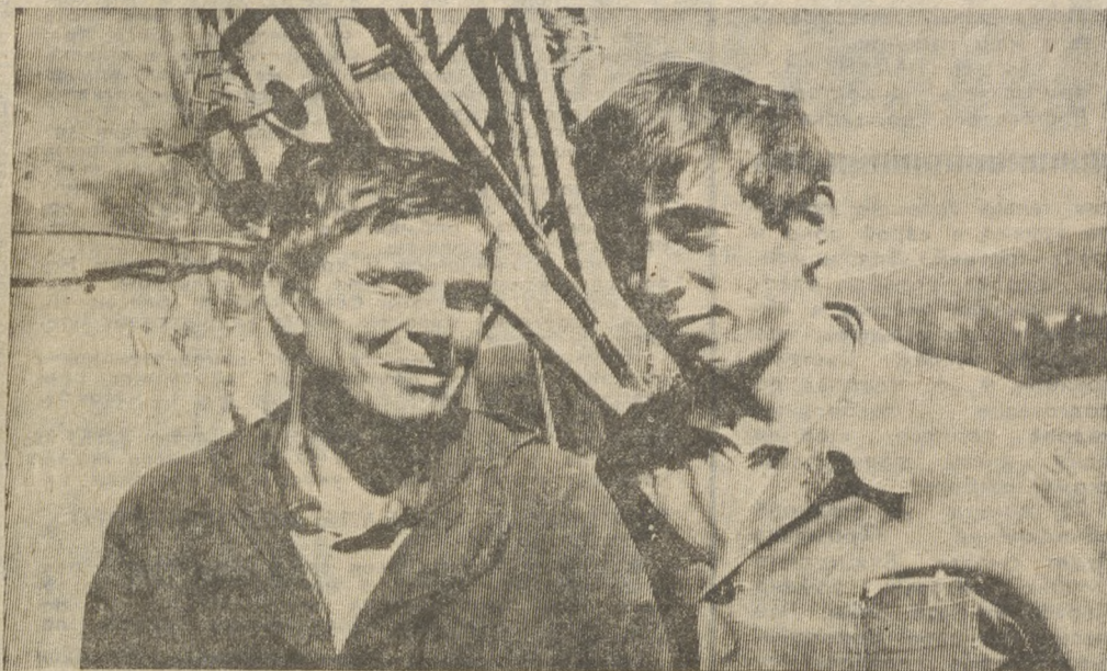
[Окончание. Начало на 1 стр.]