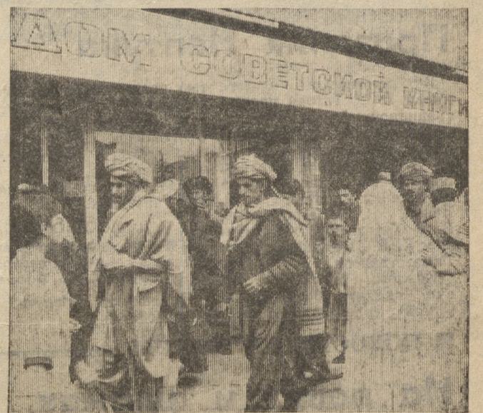
ДРА. Ярная вывеска на одном из зданий в центре Кабула — «Дом советской книги». Здесь всегда оживленно. У прилавков с советскими изданиями на русском и основных языках Афганистана — пушту и дари — можно встретить рабочих, служащих, молодежь. Тяга к советской культуре, науке и технике растет среди афганской общественности год от года. Распространением советских книг в ДРА занимается книготорговая фирма «Байхаки», вот уже несколько лет тесно сотрудничающая с «Международной книгой». Ежегодно она продает десятки тысяч книг русских и советских авторов.