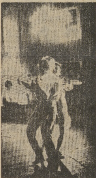
В ритме танца.

Ю. ЧЕРВОВ, председатель городской федерации бокса.