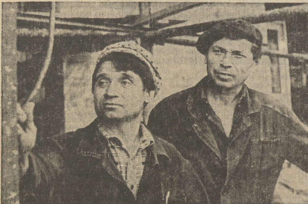
■ ПРЕСС-ЦЕНТР НА СТРОИТЕЛЬСТВЕ ПЛАВАТЕЛЬНОГО БАССЕЙНА

На прополку нет нужды создавать отряды. Но комиссары — неравнодушные люди — здесь требуются не меньше, чем на заготовке кормов.