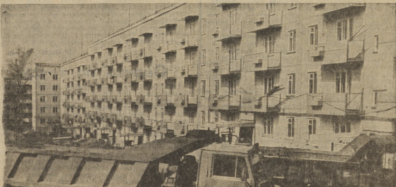
Первоуральск строится. Восьмой микрорайон.

ПОД ЗНАМЕНЕМ ЛЕНИНА 19 июня 1987 г., № 119