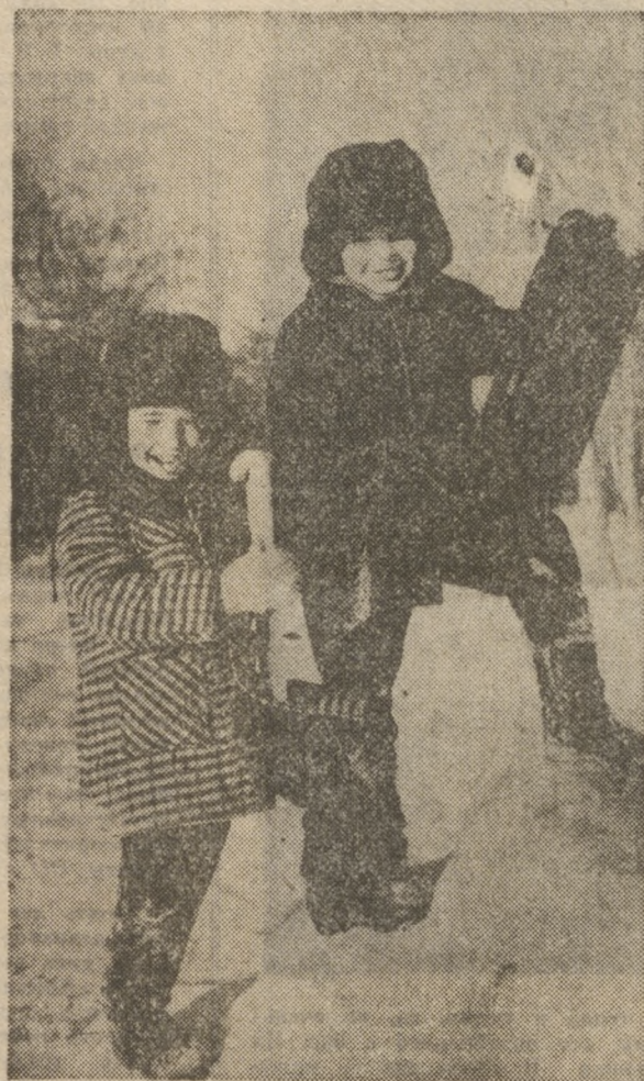
ИМ МОРОЗ НИПОЧЕМ...