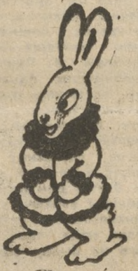
Рисунок Нины Велькиной.

Объявляем конкурс на лучшую музыку к этой песне. Только помните, что мелодия должна уместиться в пределах одной октавы. Будем рады, если юные композиторы из музыкальных школ города тоже примут участие в этом конкурсе. Ждем ваших писем.