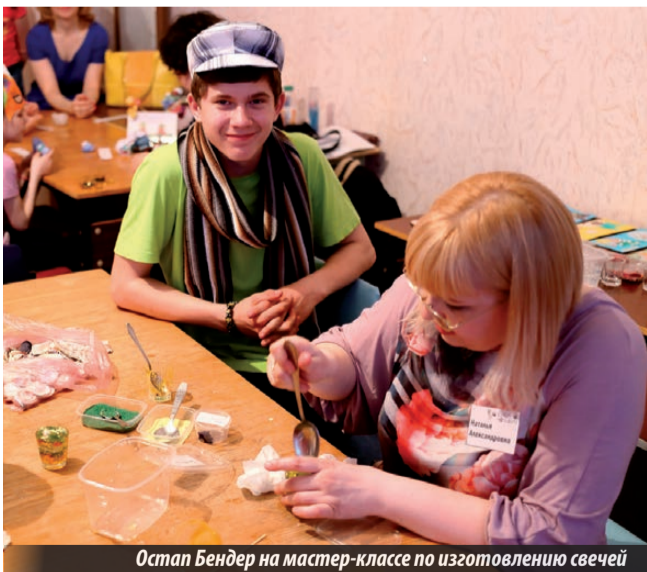
Остап Бендер на мастер-классе по изготовлению свечей

Все мы привыкли к тому, что в библиотеке обычно царит тишина. Но один раз в году все меняется, и стены священного здания наполняются шумными сюрпризами для читателей разного возраста. Насыщенные «Библиосумерки» для детей в тот вечер продолжались до 20:00, после чего их сменила взрослая «Библионочь», длившаяся в стенах книгохранилища аж до 24:00. Программа была подготовлена по книге «Двенадцать стульев» (Евгений Петров, Илья Ильф) и фильмам, снятым по ней. Посетители смогли с головой окунуться в атмосферу советской России 20-х годов XX века.