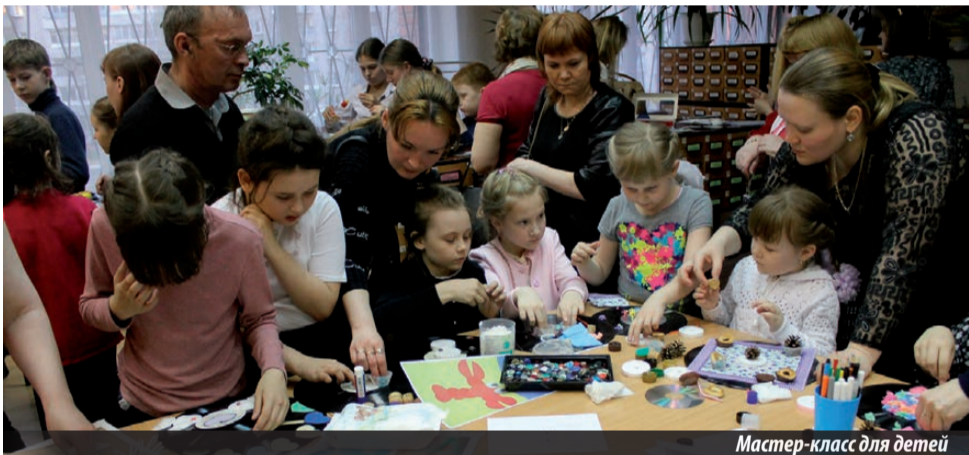
Мастер-класс для детей