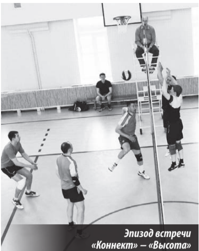
Эпизод встречи «Коннект» — «Высота»

Спартакиада молодёжи. Лесной. Дом физкультуры. 09–24.04.2016