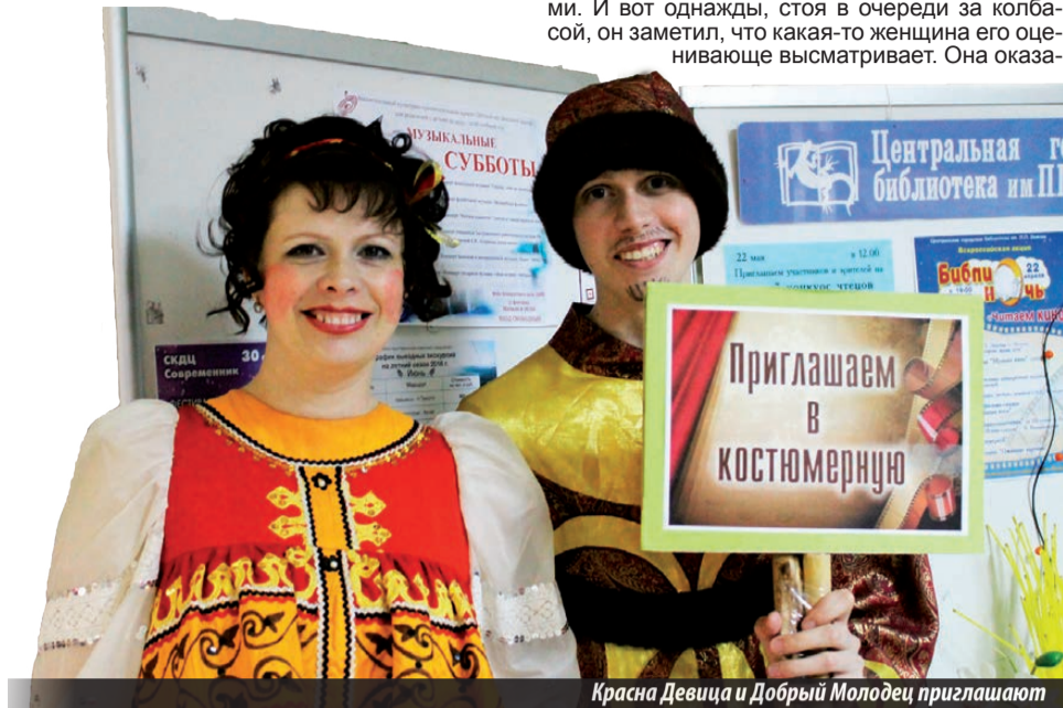
Красна Девушка и Добрый Молодец приглашают