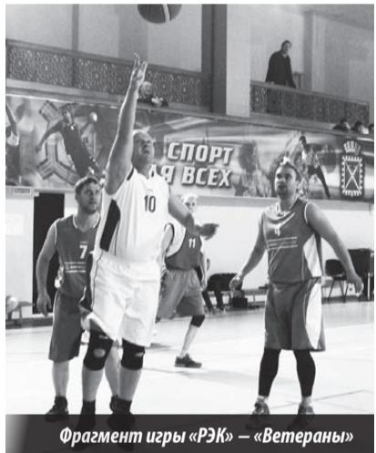
Фрагмент игры «РЭК» — «Ветераны»

Три встречи 24 апреля получились контрастными. Несмотря на то, что во второй партии «Комета» буквально «деклассировала» «Витязь», волейболисты 440-го в/п сумели собраться, перестроить игру и поймать удачу за хвост — 2:1 (25:20, 10:25, 15:11). Матч «МИФИ» — «Спутник» определял победителя группы «С». Игроки команды в/ч 3275 выбрали противников с приема, качественным блоком нейтрализовав атаки студентов, и уверенно победили 2:0 (25:16, 25:21). «Учитель» напоследок «хлопнул дверью», отвоевав одну партию у «Хайтека» 1:2 (9:25, 25:19, 11:15). Таким образом, окончательные итоги в группе «А» таковы: «Прометей» — 8 очков, «Хайтек» — 6, «Знамя» — 3, «Учитель» — 1.