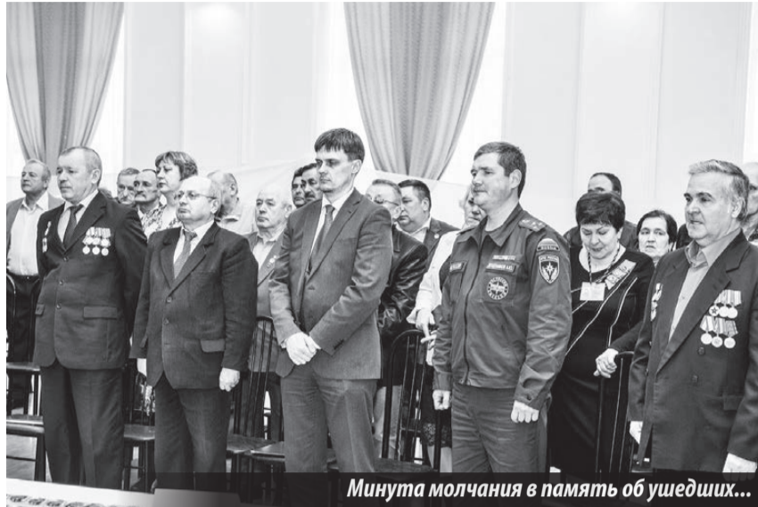
Минута молчания в память об ушедших...

К 30-летию со дня аварии на атомной электростанции