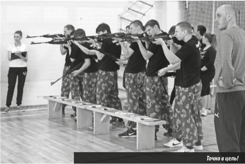
Точно в цель!