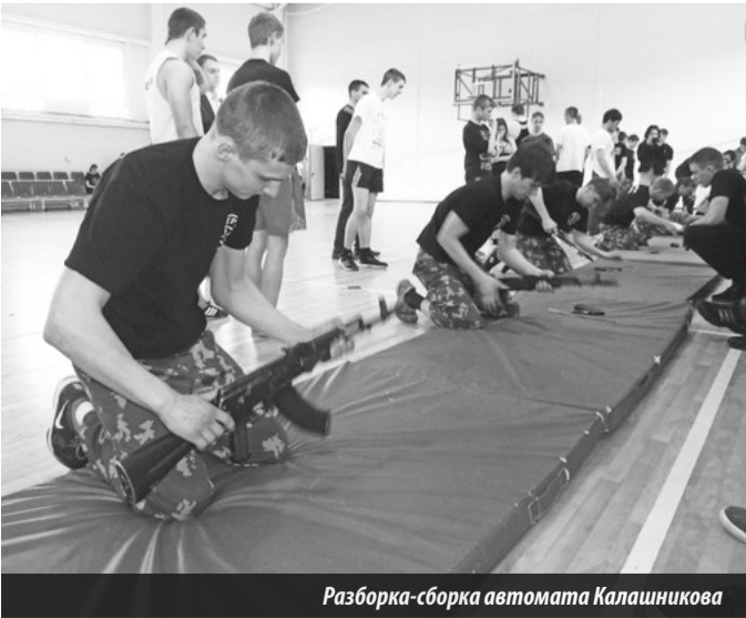
Разборка-сборка автомата Калашникова