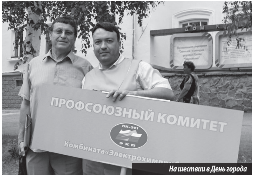
На шествии в День города

Так случилось, что знаю его очень давно. В мае 1990 года я оставила свою любимую радиожурналистику и перешла работать в отдел кадров комбината «ЭХП». Трудовой путь начала заново, так сказать, с чистого листа, с должности рядового инспектора, отвечающе-