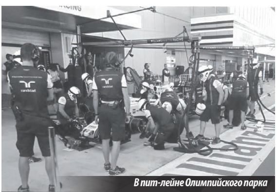
В пит-лейне Олимпийского парка

на прямых отрезках превышает 300 км/ч! За нашу страну выступал Даниил КВЯТ – самый молодой пилот в истории чемпионата «Формулы 1» (!), ставший первым российским гонщиком, стоящим в начале стартовой решетки! В этом году он выступал более стабильно, чем в прошлом сезоне. Новая команда и машина RED BULL, правда, пока без моторов, как у Mercedes и Ferrari, не позволили Квяту выиграть «на прямых».