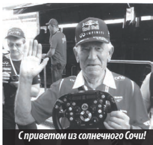
С приветом из солнечного Сочи!