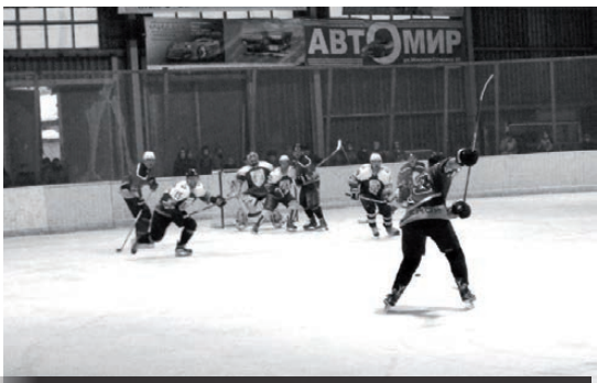
Момент игры «Факел» - «Авто-8»

Следующие две встречи хоккеисты «Факела» сыграют в гостях: 3 января — в Серове, 6 января — в Красноуральске. Ближайший домашний матч состоится 9 января против команды «Огнеборец».