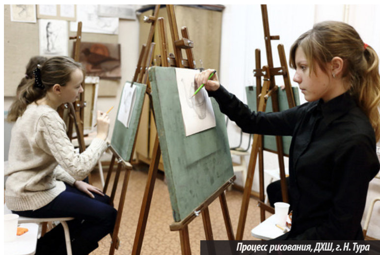
Процесс рисования, ДХШ, г. Н. Тура

Т. БАРАНОВСКАЯ, г. Нижняя Тура