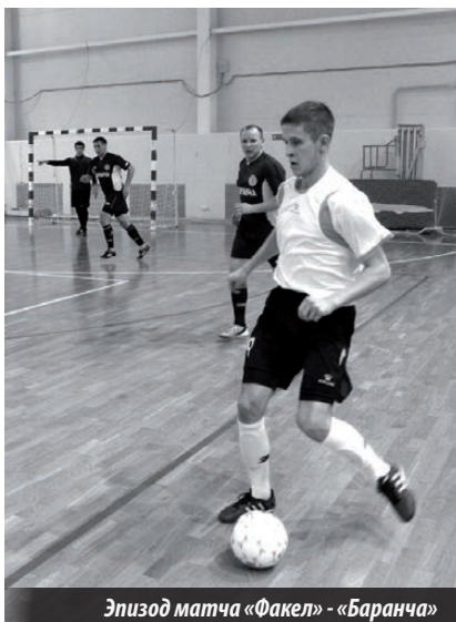
Эпизод матча «Факел» - «Баранча»