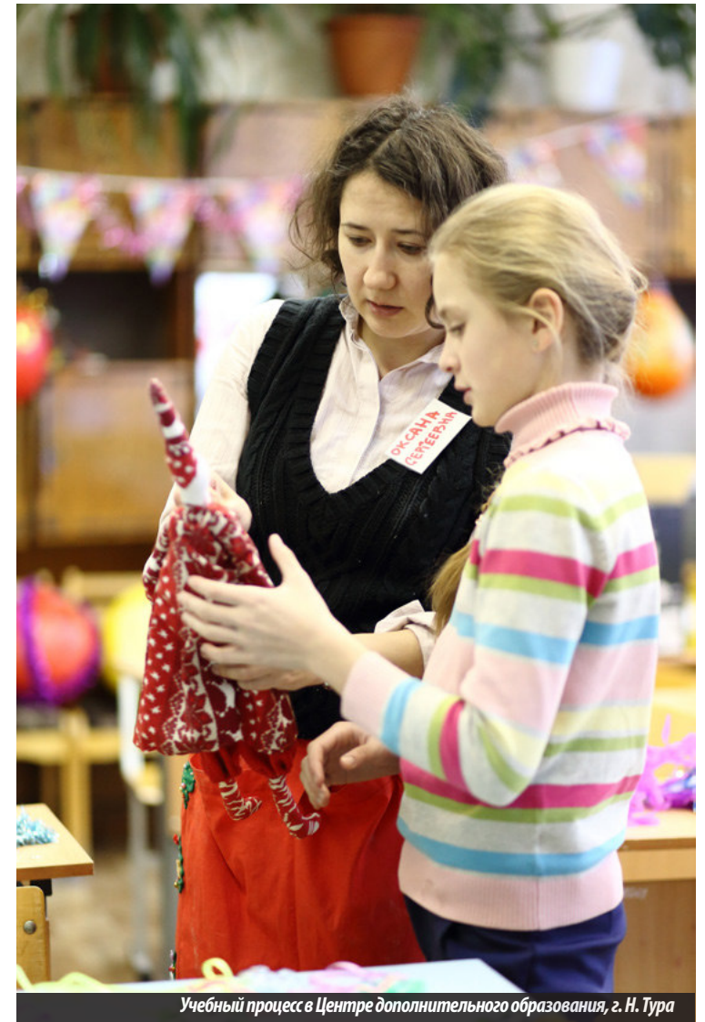
Учебный процесс в Центре дополнительного образования, г. Н. Тура